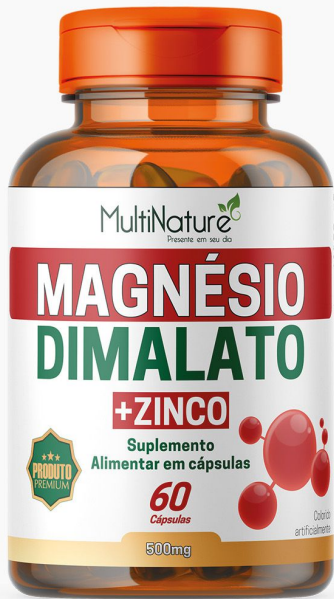
MAGNÉSIO DIMALATO + ZINCO 60 CÁPSULAS