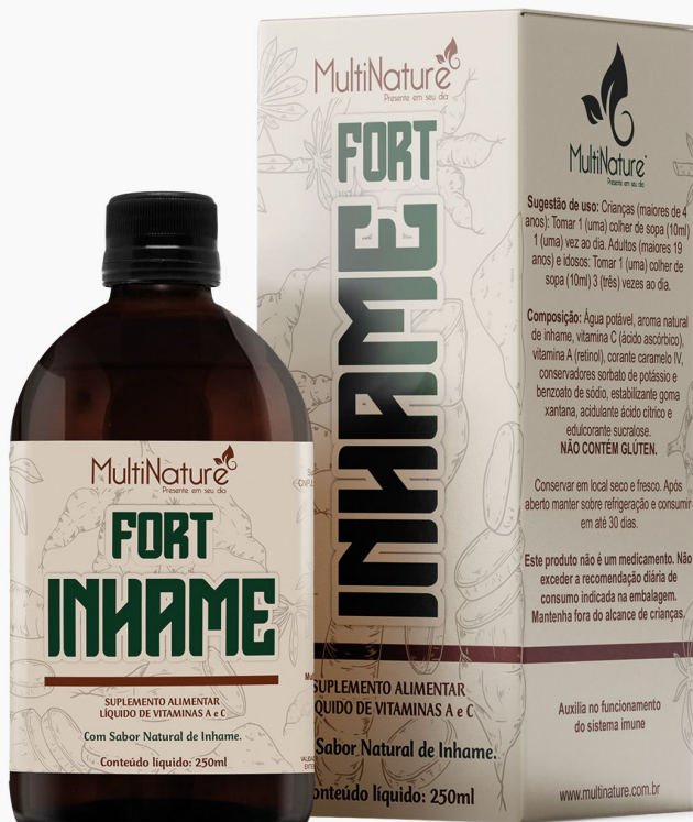
FORT INHAME 250ml