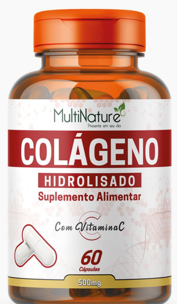
COLÁGENO HIDROLISADO C/ VIT C 60 CÁPSULAS