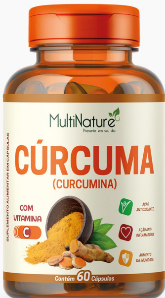
CÚRCUMA COM VITAMINA C 60 CÁPSULAS