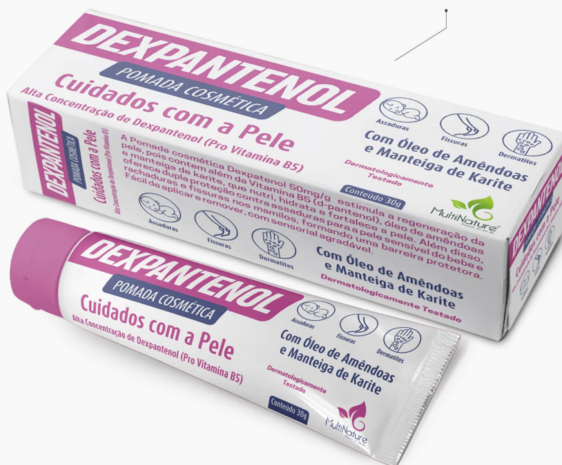
DEXPANTENOL Pomada 30g