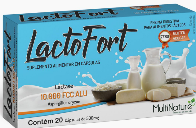
LACTOFORT Lactase - 20 Cápsulas

A lactase é uma enzima presente naturalmente no corpo humano. Ela é responsável por fazer a digestão da lactose, o açúcar presente no leite, a fim de possibilitar que seja devidamente absorvido pelo corpo, evitando transtornos digestivos.