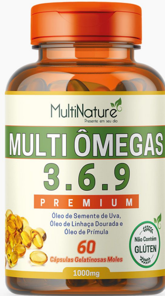
MULTI ÔMEGAS 3.6.9 - 1g. 60 CÁPSULAS