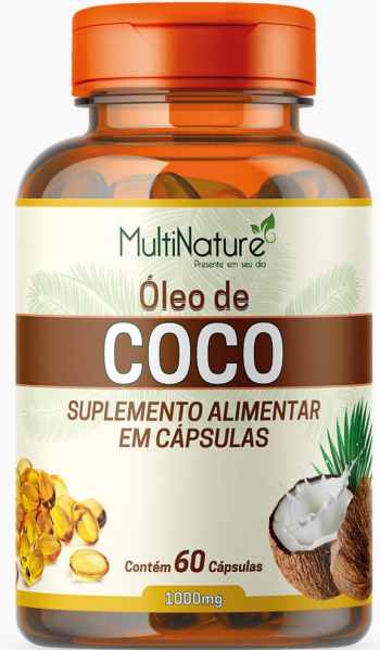
ÓLEO DE COCO 1g. 60 CÁPSULAS