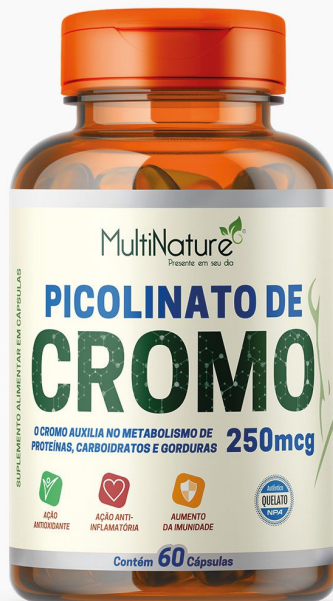
PICOLINATO DE CROMO 60 CÁPSULAS