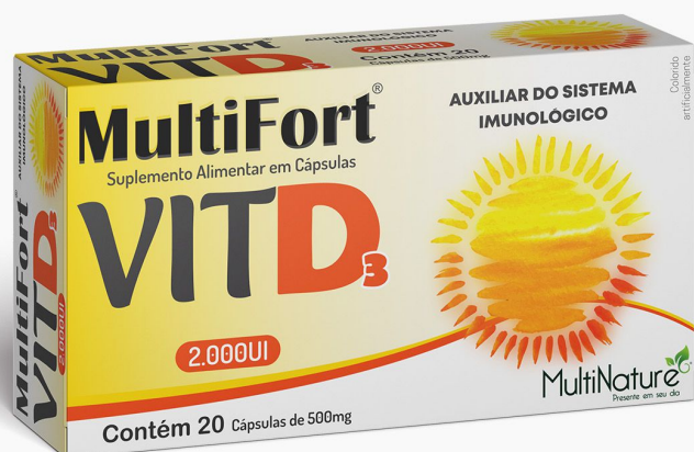
MULTIFORT VIT D3 20 Cápsulas

Suplemento Alimentar VITD3 2.000UI - Fortalece o sistema imune, auxilia na função cardíaca e no funcionamento muscular, auxilia também no processo de divisão celular e muito mais.